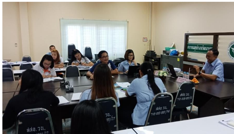
ภาพอบรมพัฒนาศักยภาพเจ้าหน้าที่เรื่องระเบียบการเงิน การคลัง พักและกฎหมายที่เกี่ยวข้อง